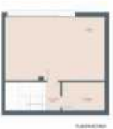
Planta 2. 2.º