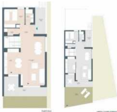
Model 02 - Tip 00 (1)