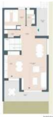
Planta 1. 1.º