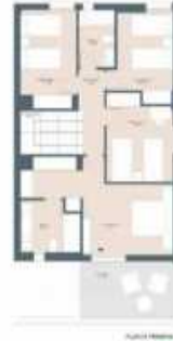
Planta 1. 1.º

Este documento es una representación gráfica de un proyecto de obra de construcción. El contenido de este documento es confidencial y no debe ser divulgado sin el consentimiento expreso de la empresa propietaria de los derechos de autor. La información contenida en este documento es solo una referencia y no debe ser utilizada como base para la toma de decisiones. La empresa no se responsabiliza de los errores o omisiones que puedan aparecer en este documento. La información contenida en este documento es solo una referencia y no debe ser utilizada como base para la toma de decisiones. La empresa no se responsabiliza de los errores o omisiones que puedan aparecer en este documento.