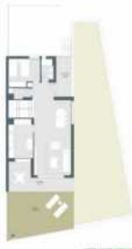
Planta 2. 2.º